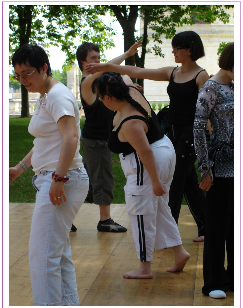
Festival des pratiques amateur de Oiron Juin 2006